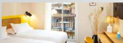
Hôtel Escaletto 3*