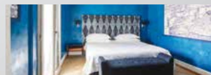
Galleria Vik Milano 5*