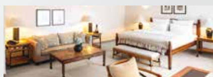
The Mandala Suites 4*