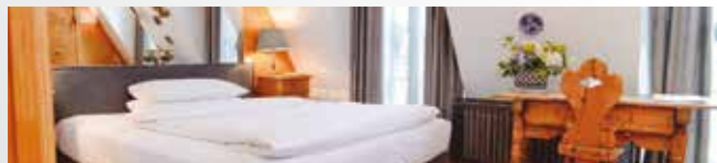
Hôtel Opéra München 4*

Le prix ne comprend pas : Le transport aérien ou ferroviaire, les repas, les boissons, les assurances assistance, rapatriement, annulation et interruption de séjour, la taxe de la ville.