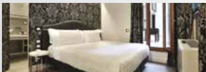
Al Teatro Palace 4*