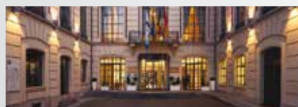
Van Der Valk Sélys Liège Hôtel &amp; Spa 4*