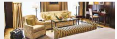
Antara New York Palace 5*

Le prix ne comprend pas : Le transport aérien ou ferroviaire, les repas, les boissons, les assurances assistance, rapatriement, annulation et interruption de séjour, la taxe de la ville.