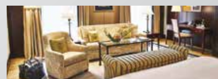
Hôtel Adlon Kempinski 5*