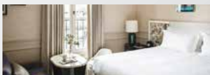
Sofitel Le Scribe Paris Opéra 5*