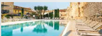
Hôtel Aquabella 4*