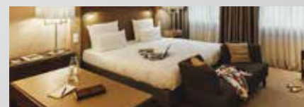
Townhouse Dresden 5*