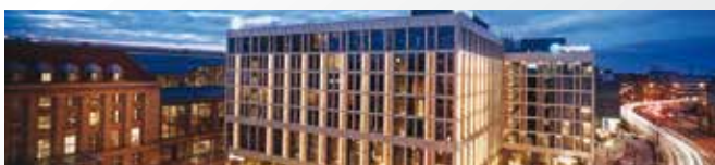
Hyperion Hotel Leipzig 4*