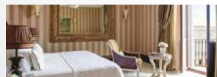
Anantara Palazzo Naiadi Rome Hotel 5*

Le prix ne comprend pas : Le transport aérien ou ferroviaire, les repas, les boissons, les assurances assistance, rapatriement, annulation et interruption de séjour, la taxe de la ville.