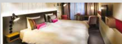
Pentahotel Liège 4*