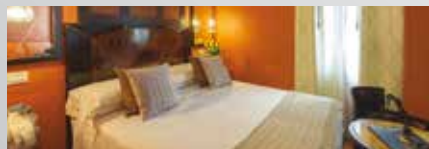
Hotel Saturnia &amp; International 4*