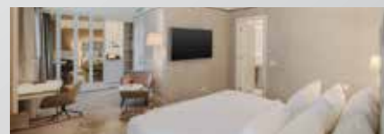
Hôtel NH Collection Verona 5*