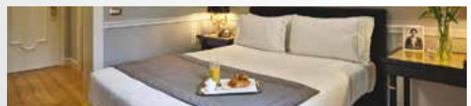
Grand Hôtel et des palmes 5*

Le prix ne comprend pas : Le transport aérien ou ferroviaire, les repas, les boissons, les assurances assistance, rapatriement, annulation et interruption de séjour, la taxe de la ville.