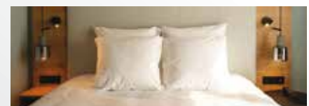
Radisson Liège City Centre 4*

Le prix ne comprend pas : Le transport aérien ou ferroviaire, les repas, les boissons, les assurances assistance, rapatriement, annulation et interruption de séjour, la taxe de la ville.