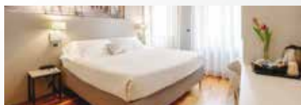
Hotel Guilietta e Romeo 3*