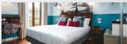
Hôtel Indigo 4*