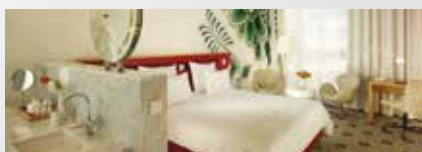
Hyperion Hotel Dresden am Schloss 5*