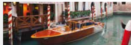
Hotel Splendid Venice 4*

Le prix ne comprend pas : Le transport aérien ou ferroviaire, les repas, les boissons, les assurances assistance, rapatriement, annulation et interruption de séjour, la taxe de la ville.