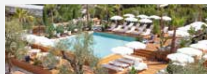
Hôtel Renaissance 5*

Le prix ne comprend pas : Le transport aérien ou ferroviaire, les repas, les boissons, les assurances assistance, rapatriement, annulation et interruption de séjour, la taxe de la ville.