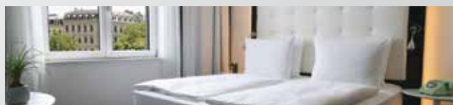
Inside by Meliá Leipzig 4*