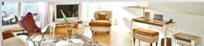
Cortiina Hotel 4*