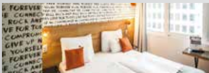
Room bach hôtel 3*