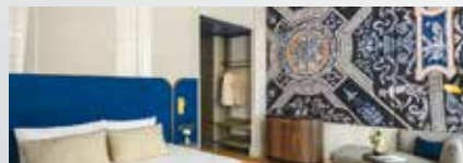
Hôtel Moments Budapest 4*