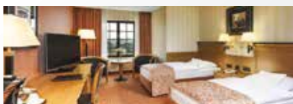
Maritim Hotel & Internationales Dresden 4*