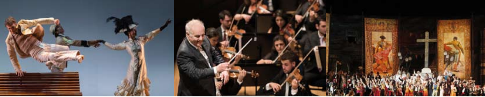
La Bella Otero - Festival Internacional de Música y Danza © Jesús Vallinas Daniel Barenboim © Priska Ketterer / Lucerne Festival Carmen - Festival dell'Arena di Verona 2020 © Ennevi