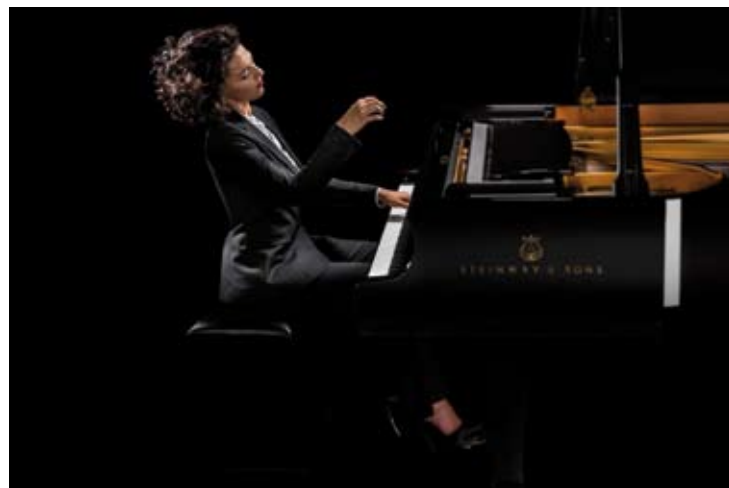
Khatia Buniatishvili

Fauré - Franck - Poulenc Emmanuel Pahud, Eric Le Sage 26 / 6 (Theater am Ring - Saarlouis)