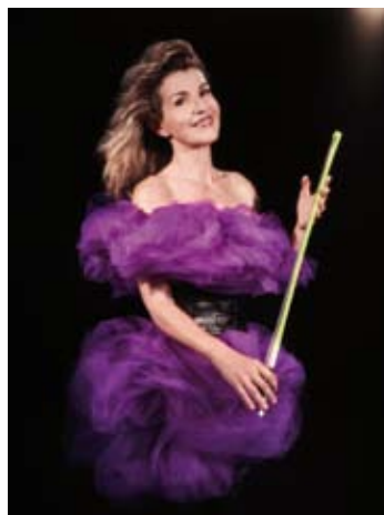
Anne-Sophie Mutter