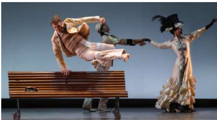
La Bella Otero Festival Internacional de Música y Danza

Say : Piano Concerto Water Sibelius : Symphony No. 2 Ciobanu Alexandra Silocea George Enescu Philharmonic Orchestra Alexandre Bloch 24m / 9 (Sala Radio)