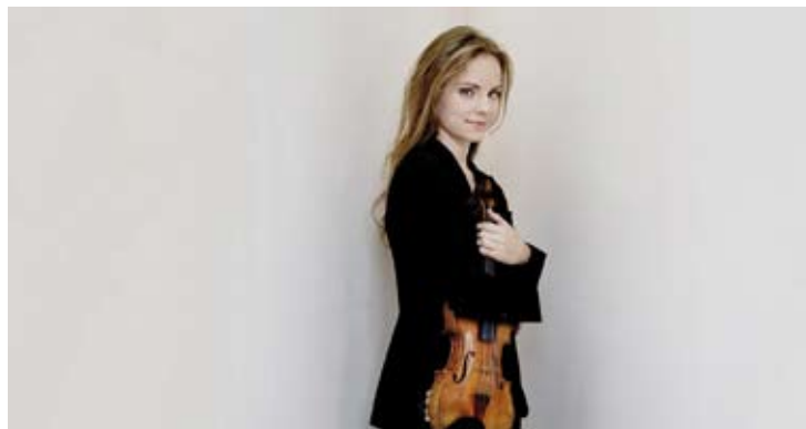
Julia Fischer