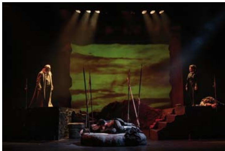
Siegfried - Longborough Festival Opera 2022