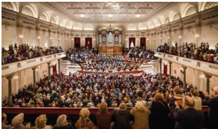
Het Koninklijk Concertgebouw Amsterdam

Brahms - Françaix Corneille Piano Quartet 9 / 7 (Muziekgebouw (Kleine Zaal))