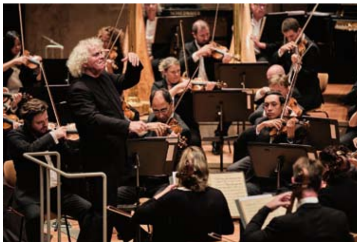
London Symphony Orchestra, Sir Simon Rattle

Corelli - Händel - Pasquini - Scarlatti A. Edoardo Bellotti 25 / 8 (Kirche St. Willehadi - Osterholz)