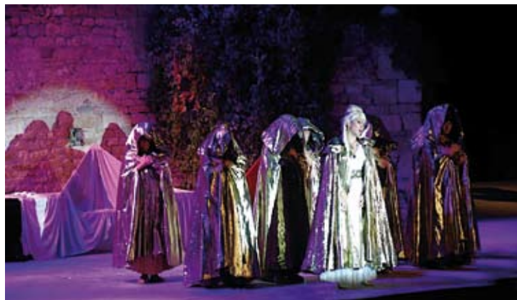
La belle Hélène