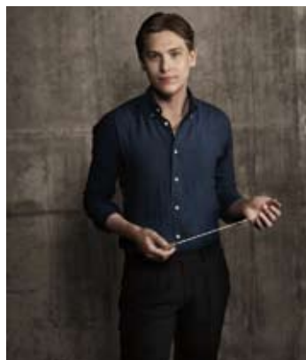
Klaus Mäkelä

Albéniz - Fauré - Ginastera - Rachmaninov Pierre Venissac 17 / 7 (Palmarium - Bagnères-de-Bigorre)