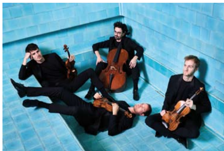
Quatuor Agate

Bartók - Dvorák - Kreisler - Suk Vadim Tchijik, Armine Varvarian 20 / 7 (Place du Collège)