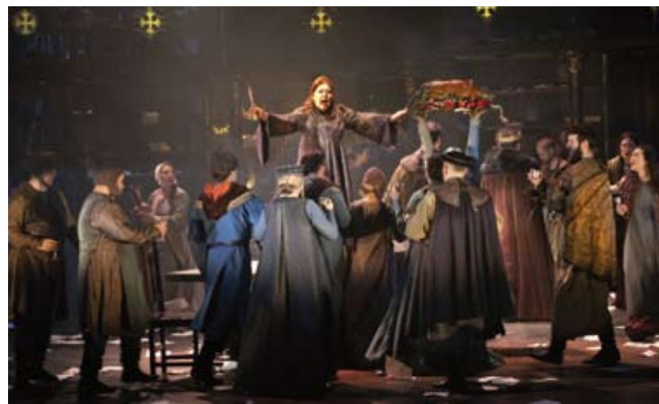
Macbeth - The Grange Festival