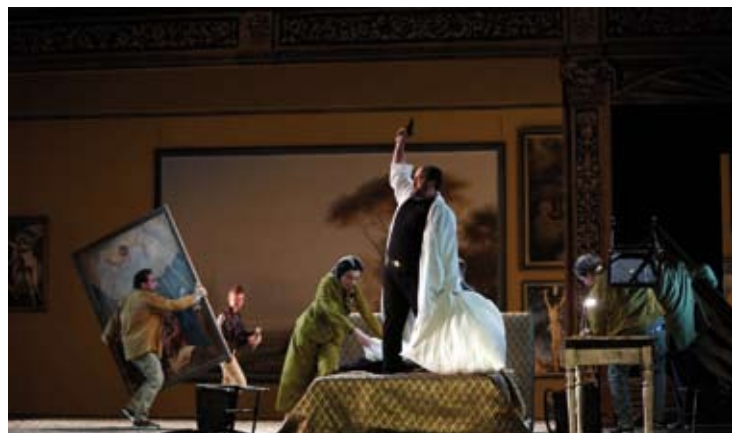
Il Trittico Internationale Maifestspiele