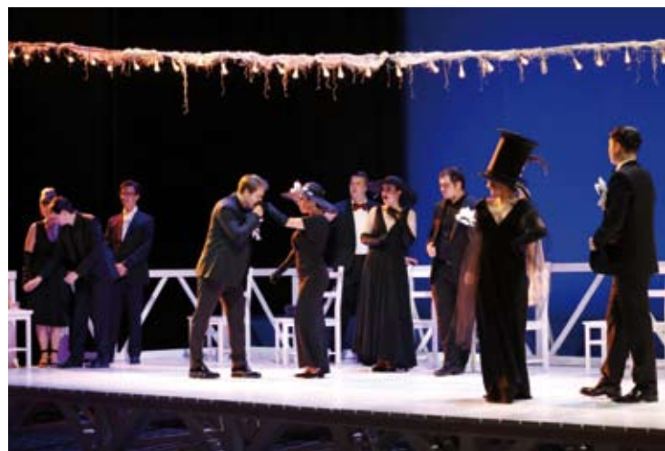
Il Viaggio a Reims

ROSSINI : IL VIAGGIO A REIMS Andrea Foti / Emilio Sagi 16m, 18m / 8 (Teatro Rossini)