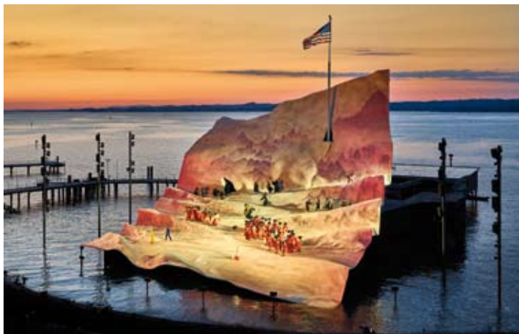
Madama Butterfly - Bregenz Festspiele

Sibelius : Symphony No. 1 Ravel - Korngold Benjamin Schmid Wiener Symphoniker Marie Jacquot 7 / 8 (Festspielhaus)