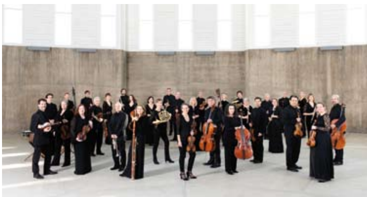
Academy of St Martin in the Fields

Schubert : Orchesterlieder Schumann : Symphony No. 4 Mayer Nika Goric Landesjugendorchester Mecklenburg- Vorpommern Stanley Dodds 26 / 7 (Guttscheune - Niendorf auf Poel)