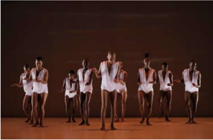
Dada Masilo's TheSacrifice

Beethoven - MacMillan - Mozart Brentano String Quartet 18 / 7 (Chautauqua Auditorium)