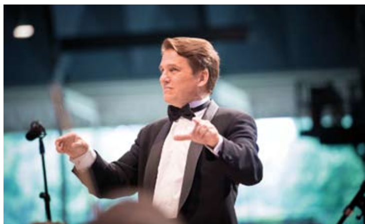
Keith Lockhart

Brahms : Piano Concerto No. 1 Roustan : The Clustered Vine (WP) Weber Kelley O'Connor, Yefim Bronfman Festival Orchestra Donald Runnicles 11, 12 / 8 (Walk Festival Hall)