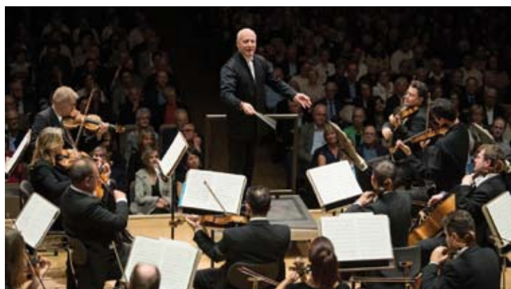
Paavo Järvi

Berlioz : Symphonie Fantastique Berlioz : L'Élé ou Le Retour à la vie Orchestre National du Capitole de Toulouse Josep Pons 2 / 9 (Sala Mare a Palatului)