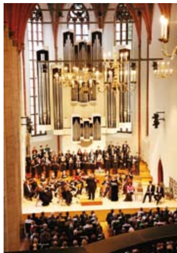
Konzerthall Ulrichskirche