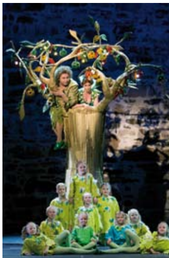
Die Zauberflöte Savonlinna Opera Festival