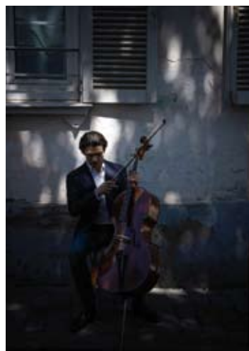
Gautier Capuçon

Bach : Das Wohltemperierte Klavier I Aaron Pilsan 22m / 7 (São Tiago Church)