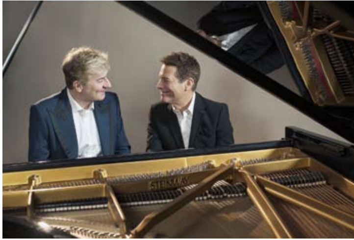
Jean-Yves Thibaudet

Montero : Piano Concerto Latin Ortiz : Antropolis Panufnik - Villa-Lobos Gabriela Montero Chicago Symphony Orchestra Marin Alsop/Valentina Peleggi 21 / 7 (Pavilion)