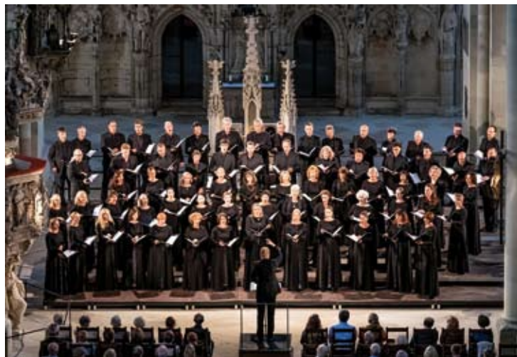
MDR-Rundfunkchor