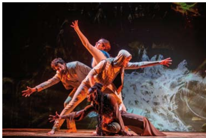
Festival 0 - Unholy Wars

Dance/Danse/Tanz : Romeo and Juliet Choreography by Kenneth MacMillan 18, 19m, 19, 20, 21, 22m, 22 / 7 (The Metropolitan Opera)