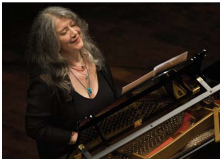
Martha Argerich