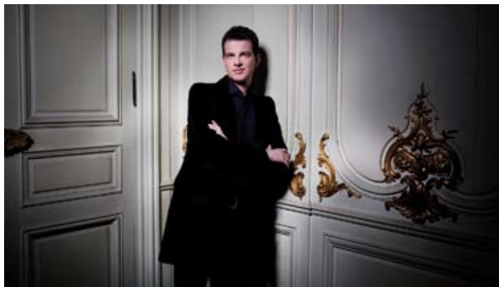
Philippe Jaroussky

Dance/Danse/Tanz : Swan Lake Ballet Preljocaj Choreography by Angelin Preljocaj 26 / 7 (Théâtre Antique)