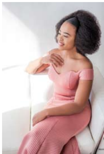
Pretty Yende

Piano Recital Geister Duo 17 / 7 (Halle aux grains - Bagnères-de-Bigorre)