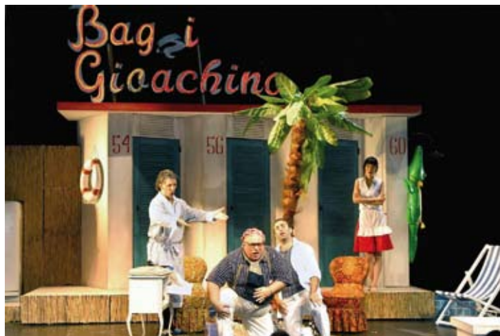
Il Signor Bruschino