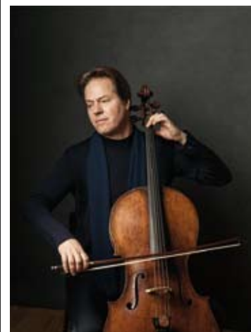
Jan Vogler

Beethoven : Symphony No. 8 Shepherd : NW Jan Vogler Philharmonisches Staatsorchester Hamburg Kent Nagano 5 / 5 (Kulturpalast)