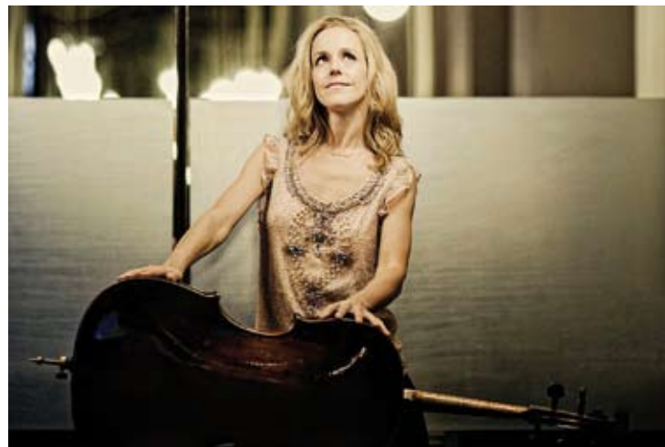
Sol Gabetta