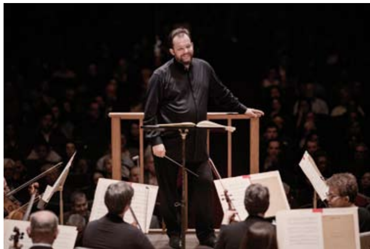
Andris Nelsons

Mozart : Piano Concerto No. 9 K. 271 «Jeunehomme» Bartók : Concerto for Orchestra Seong-Jin Cho Boston Symphony Orchestra Susanna Mälkki 12 / 8 (Koussevitzky Music Shed)