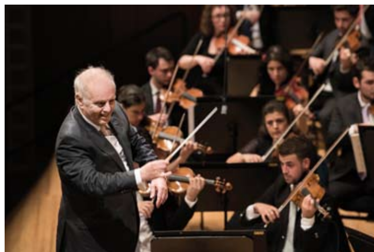
Daniel Barenboim