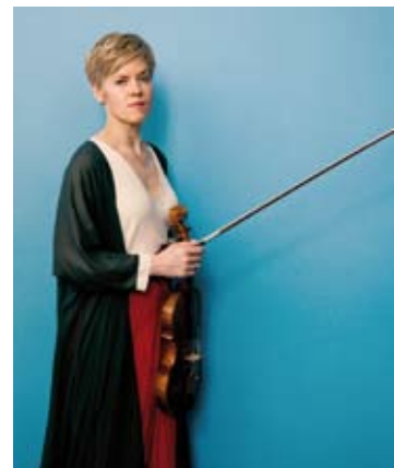
Isabelle Faust