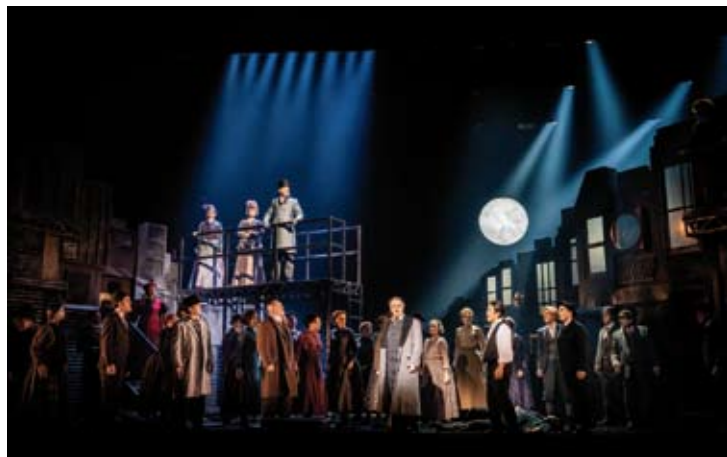
Roméo et Juliette Savonlinna Opera Festival

ROSSINI : LA CENERENTOLA 5, 11, 12 / 8 (Amphitheatre)