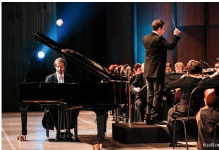
Nikolay Lugansky © Nikita Larionov

Hersant - Las Huelgas - Von Bingen - Ødegaard Dyson Ensemble Oriscus 20, 23 / 8 (Grand Couvent (Chapelle) - Gramat)