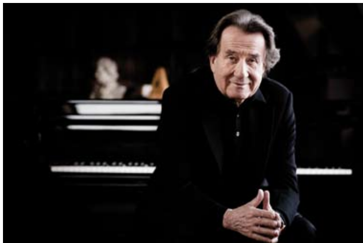
Rudolf Buchbinder