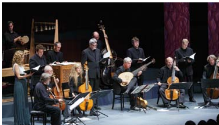
Hespèrion XXI

Telemann - Vivaldi Michael Hell Art House 17 Michael Hall 16m, 16 / 7 (Schloss Eggenberg)