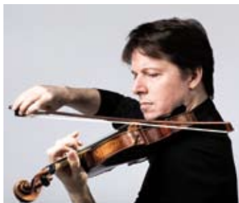
Joshua Bell

Debussy - Gershwin - Korngold - Mahler - Ravel Eckart Runge, Jacques Ammon 14 / 7 (Ernst-Barlach-Stiftung - Güstrow)