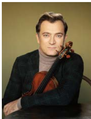
Renaud Capuçon

Byrd : Mass for Four Voices Robin Pharo Près de votre oreille Robin Pharo 1m / 7 (Eglise Saint-Martin)