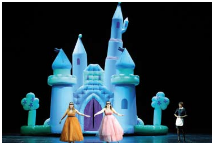
Così fan tutte 2022 / Münchner Opernfestspiele