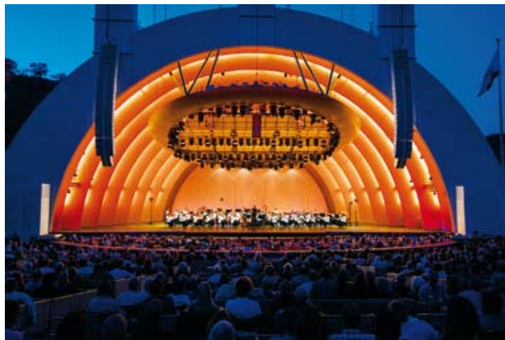
Hollywood Bowl shell with orchestra on stage