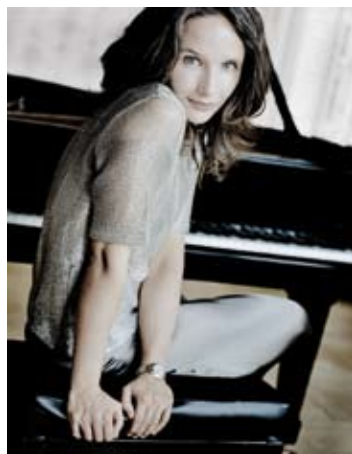
Hélène Grimaud

Debussy - Fauré - Franck Syntonia Quintette 11m / 5 (Salle Caillaux (Hôtel du Département) - Le Mans)