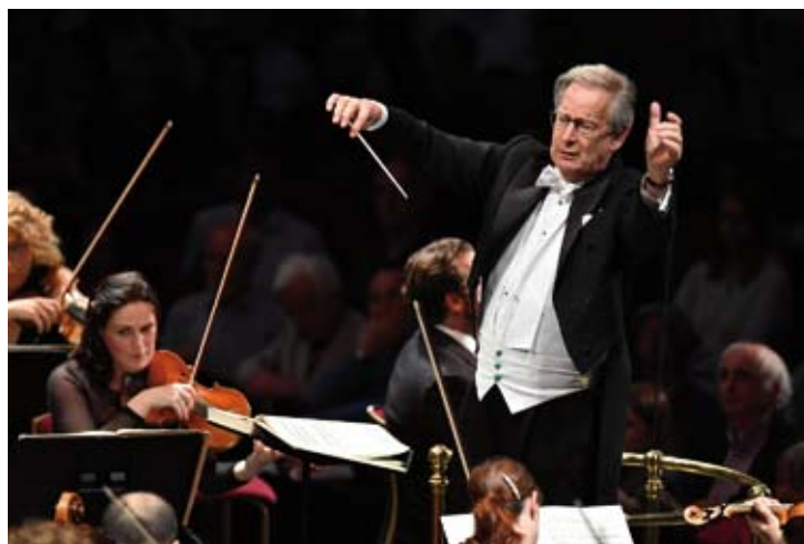
John Eliot Gardiner