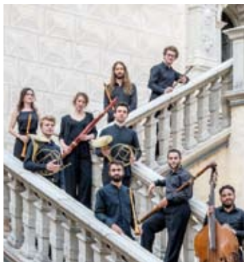
Ensemble Sarbacanes Les Musicales du Lubéron

Bizet - De Meij - Galante - Gershwin - Fukuda Josef Christ Orchester Junge Bläserphilharmonie Ulm 31 / 7 (TBA)