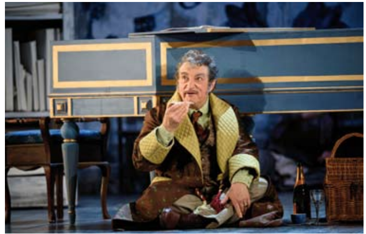
Il Barbiere di Siviglia - Glyndebourne Festival Opera 2019

Dvorák - Finzi - Kodály - Kendall The Ringlemere Quartet 13m / 7 (St George's Church)