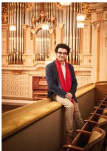
Rolando Villazon