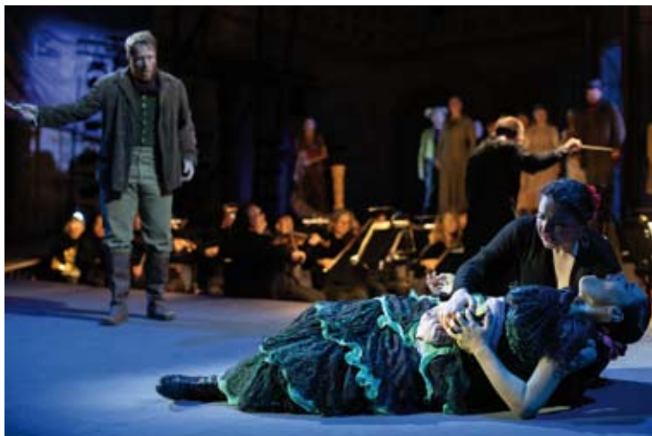
Carmen - Opera Holland Park 2022

Boccherini - Castell - Brunetti Concerto 1700 13 / 5 (St John's, Smith Square)