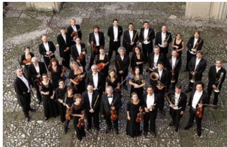
Fabio Biondi & Europa Galante

Beethoven : Piano Concerto No. 4 Beethoven : Symphony No. 7 Matthias Kirschnereit Orquestra Gulbenkian Miguel Sepúlveda 22 / 7 (Centro de Artes e Espectáculos - Portalegre)