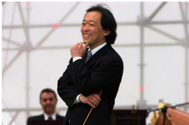
Myung-Whun Chung

Mahler : Symphony No. 6 Czech Philharmonic Orchestra Semyon Bychkov 28m / 5 (Gewandhaus)