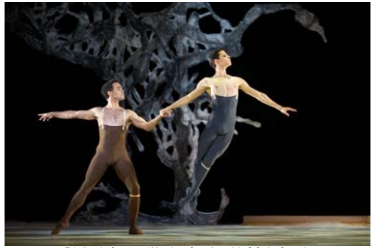
Tchaikovsky Overtures / Münchner Opernfestspiele

Strauss R. Marlis Petersen Bayerisches Staatsorchester (Members) Vladimir Jurowski 8 / 7 (Nationaltheater)