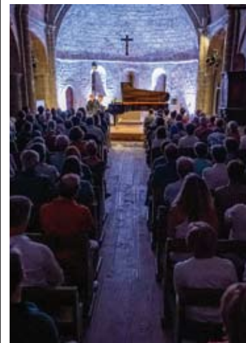
Festival Messiaen au Pays de la Meije

Magalhaes : Après la tempête, a songbook for Shakespeare (WP) Ensemble L'itinéraire Alphonse Cemin 24 / 7 (Eglise Notre-Dame de l'Assomption)