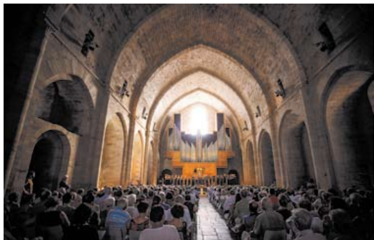
Concert dans l'abbatiale de Sylvanès

Chopin - Mozart - Rachmaninov Kotaro Fukuma 25m / 6 (Eglise Saint Germain - Sully sur Loire)