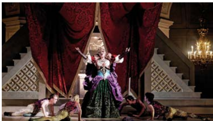
David et Jonathas / Musikfestspiele Potsdam Sanssouci