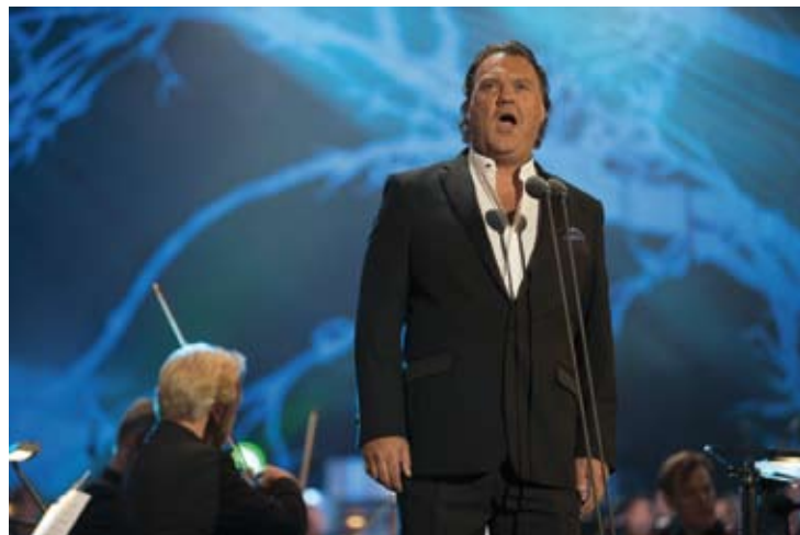
Bryn Terfel

Purcell Le Banquet Céleste Damien Guillon 19 / 7 (Cathédrale Saint-Pierre)