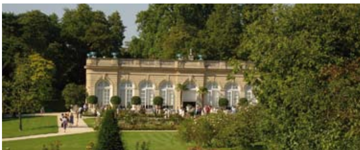
Orangerie Parc de Bagatelle

Khatia Buniatishvili Orchestre National de Lyon Kirill Karabits 2 / 7 (Théâtre Antique)