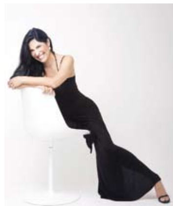
Vivica Genaux

Granados - Ravel - Tsintsadze Avi Avital Between Worlds Ensemble Avi Avital 27 / 5 (Konzerthaus - Ravensburg)