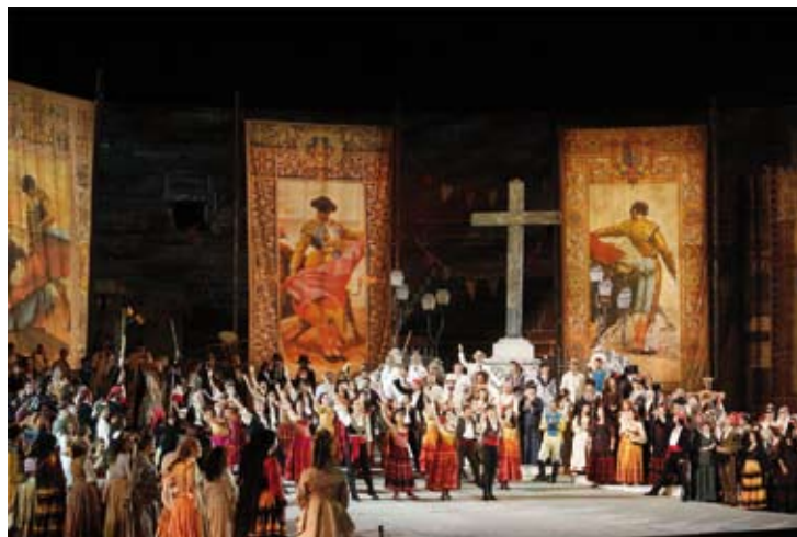
Carmen - Festival dell'Arena di Verona 2020

Akiko Sakuma Berliner Philharmoniker (Members) 14 / 7 (Concert Hall Kitara - Sapporo)