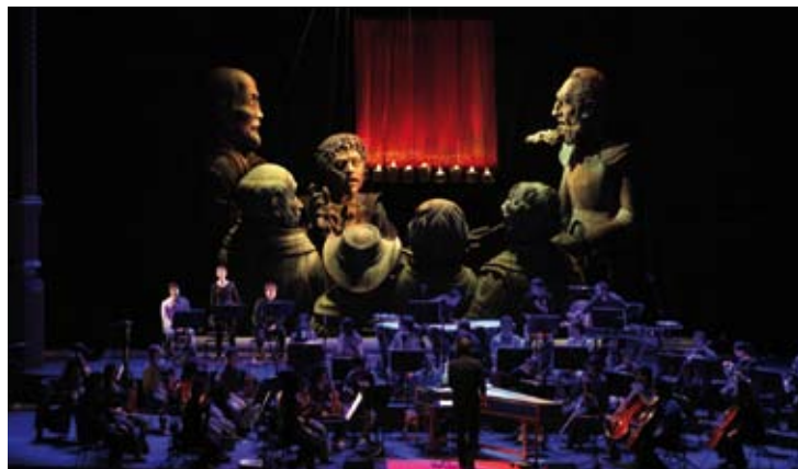
El Retablo de Maese Pedro Festival Internacional de Música y Danza © Enrique Lanz

PURCELL : THE FAIRY QUEEN Solistes du «Jardin des Voix» Les Arts Florissants Juilliard Dance/Compagnie Käfig William Christie / Mourad Merzouki 24 / 9 (Ateneul Român)