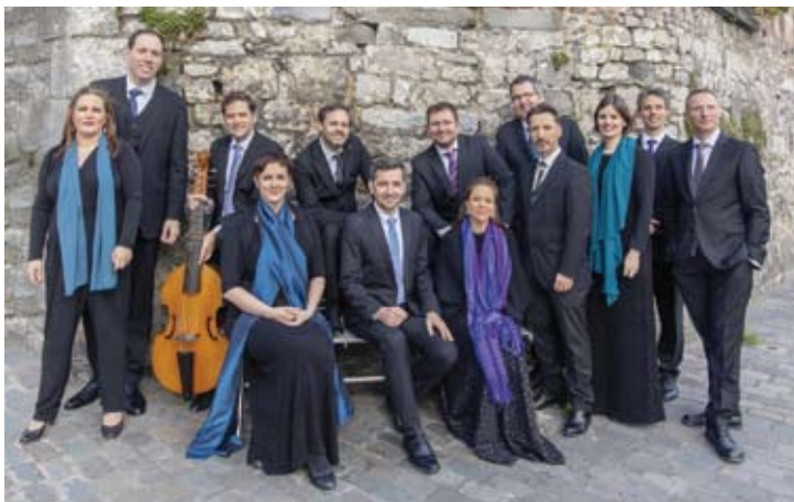
Vox Luminis - Boston Early Music Festival

LÓPEZ : BEL CANTO N.N. Aspen Chamber Symphony Patrick Summers / Kevin Newbury 21 / 7 (Benedict Music Tent)