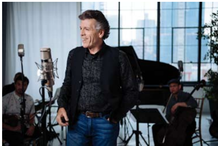
Thomas Hampson