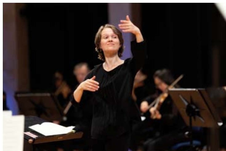
Mirga Gražinyte-Tyla