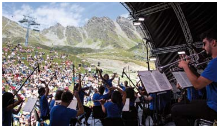
Verbier Festival - La Chaux

Brahms - Schubert Renaud Capuçon, Alexander Sitkovetsky Vadim Repin, Antoine Tamestit Klaus Mäkelä, Mischa Maisky Yefim Bronfman, Yuja Wang 25 / 7 (Salle des Combins)