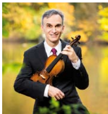
Gil Shaham

Vocal & Chamber Music Concert Madrigal National Chamber Choir 7 / 9 (Ateneul Român)