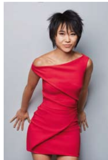
Yuja Wang